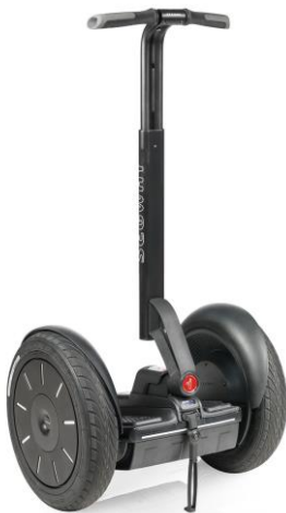
Segway PT i2 SE 基本モデル