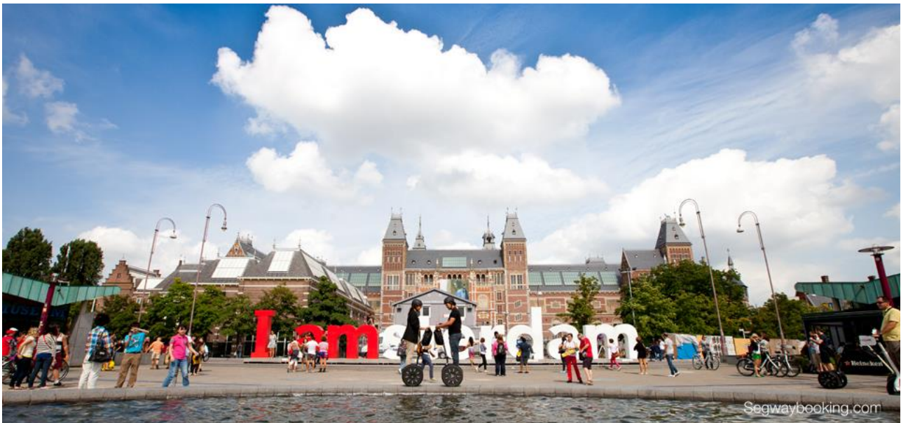
シティガイドツアー アムステルダム

国内においては、つくば市及びロボット特区実証実験協議会が、構造改革特別区域法に基づくモビリティロボット実証特区の認定を受け、2011年6月からつくばセンター駅周辺歩道での実験を進めており、既にまち巡りツアーに高い効果があることが実証されています。